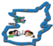
Asociación Mub'abyol (Encuentro de Expresiones)